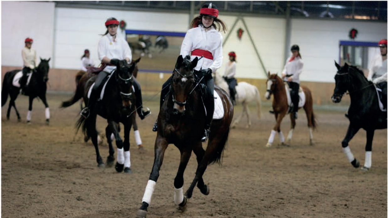
Aufgalopp der märchenhaften Reitabteilungen: Das Weihnachts-Schaureiten beim ZRFV im Nierenhof zog die Zuschauer am Balkhauser Weg in seinen Bann.