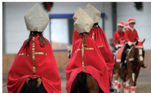
Besinnliches vom berittenen Nachwuchs: Die Aktiven des Reitvereins vereinen wieder Pferdsport und Feststimmung.