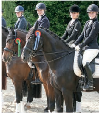
Um die begehrten Schleichen geht es auf der Anlage in Nierenhof.

Weitere Höhepunkte sind ab Samstagmittag die Intermediaire A