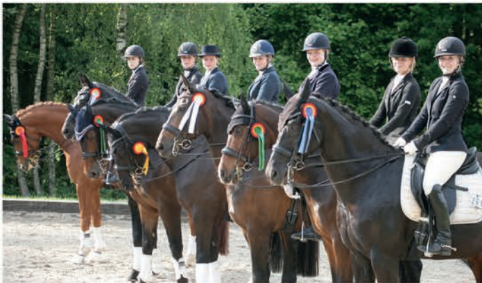
Schön aufgereiht: Sieger und Platzierte des ZRFV Hattingen beim Dressurfinale der Klasse M auf der Anlage am Balkhauser Weg.