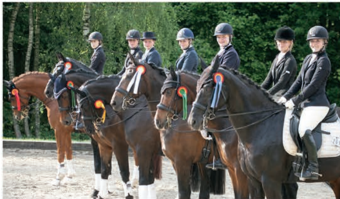
Schön aufgereiht: Sieger und Platzierte des ZRFV Hattingen beim Dressurfinale der Klasse M auf der Anlage am Balkhauser Weg.