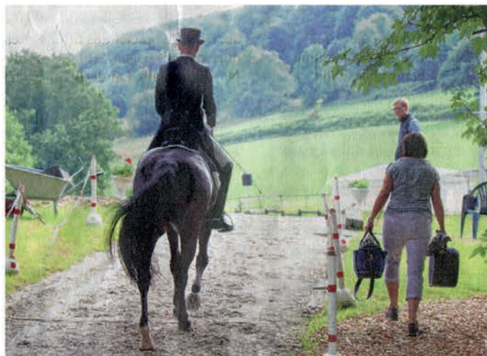
Wunderbare Kulisse in Nierenhof: Das Turnier war nicht nur gut organisiert, die Reiter hatten auch Glück mit dem Wetter.