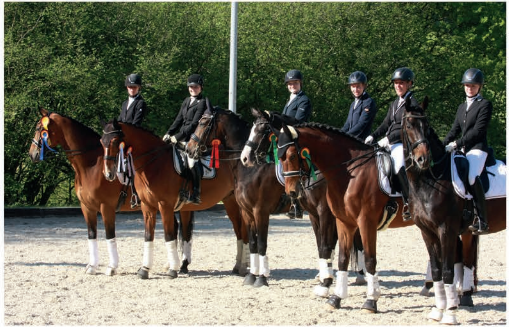
Bereit zum Start ins Maiturnier und in die grüne Saison: Am Donnerstag gibt es beim Zucht-, Reit- und Fahrverein die drei Nierenhofer Reitertage, die auch als Maiturnier bekannt sind. Am Samstag und Sonntag geht es weiter.

An diesem Feiertag gibt es neben den Dressuren der Klasse A auf dem Platz zwei Dressuren der Klasse M, die beide als Qualifikationsprüfungen für die Finale ausge-