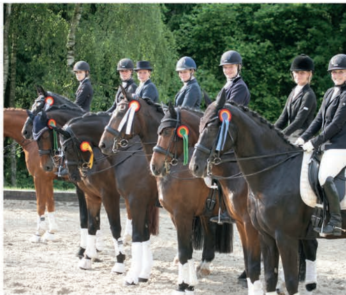
Um diese Schleifen geht es am Wochenende – hier zeigen die Sieger der M-Dressur des Maiturniers ihre Ausbeute.